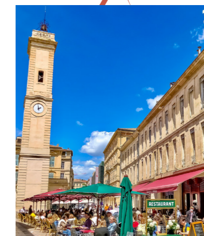
Place de l'Horloge

Nîmes est une ville dynamique sur le plan économique, classée 5ème parmi les métropoles intermédiaires en 2021. L'aéroport de Nîmes Grande Provence Méditerranée, situé près de Carons et en constante expansion, porte le nom de la ville. Nîmes se trouve dans une zone géographique privilégiée, entre mer et montagne, à la rencontre de la Provence et du Languedoc.