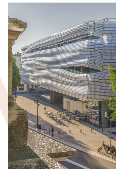
Musée de la Romanité